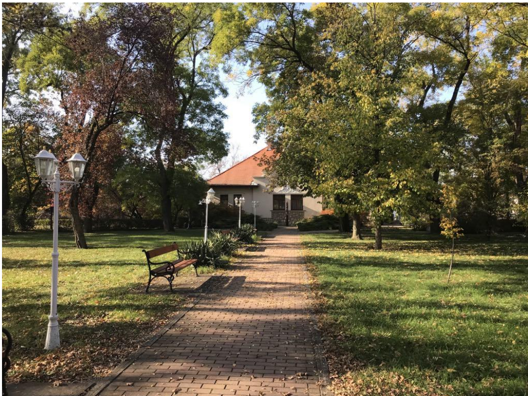
Október 23-a tér a Községháza mellett