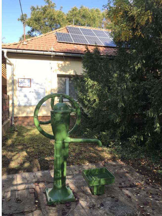
Az Egészségház előtt található kút