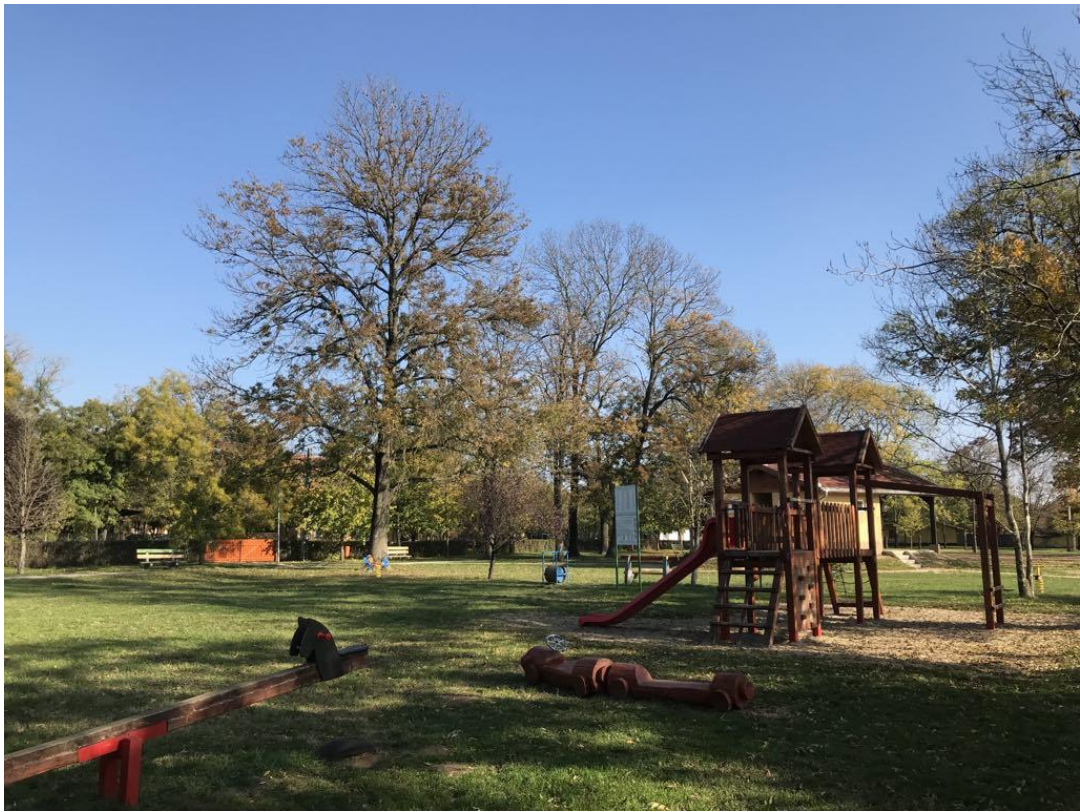
Petőfi utcai rendezvénytér