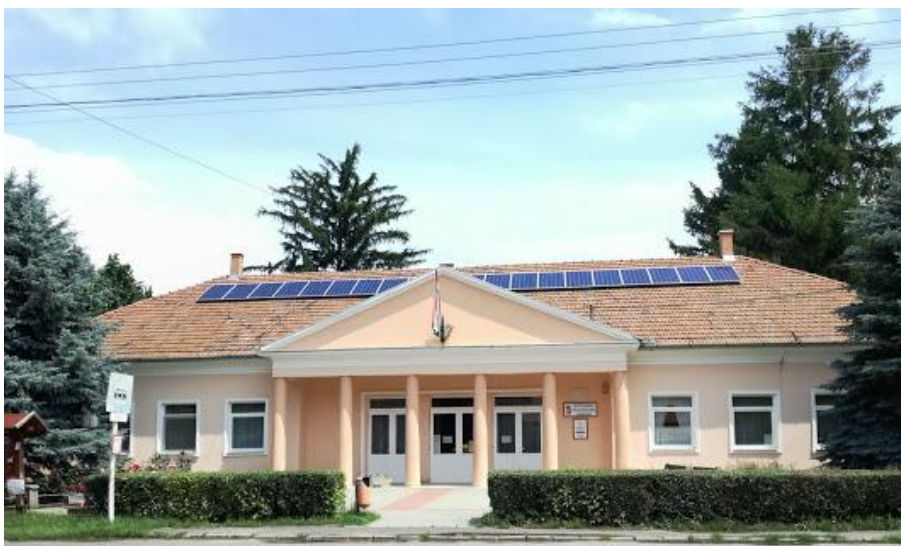
Eötvös József Művelődési Ház

Az Eötvös Józsefről elnevezett közelmúltban felújított művelődési házban több civil szervezet működik a kulturált időtöltés és hagyományörzés igényével. A sportpálya és a tornaterem szolgál a szabadidő-sportok téli-nyári helyszínéül.