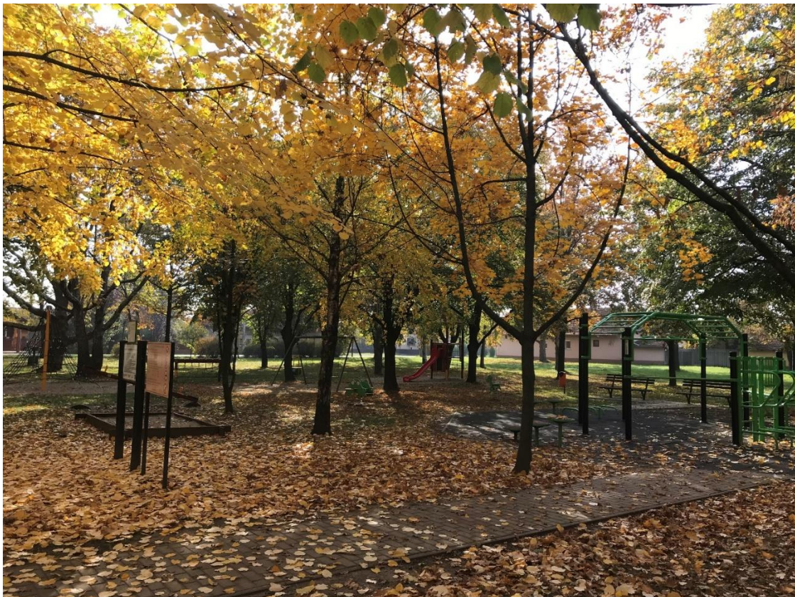
Hársliget Óvoda melletti játszótér és edzőpark őszi időben