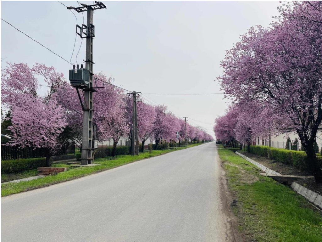
A vérszilvafa virágzása a Szabadság utcán