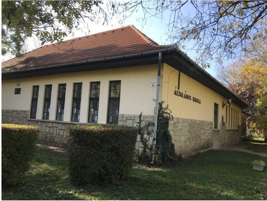
Trefort Ágoston Általános Iskola alsó tagozata