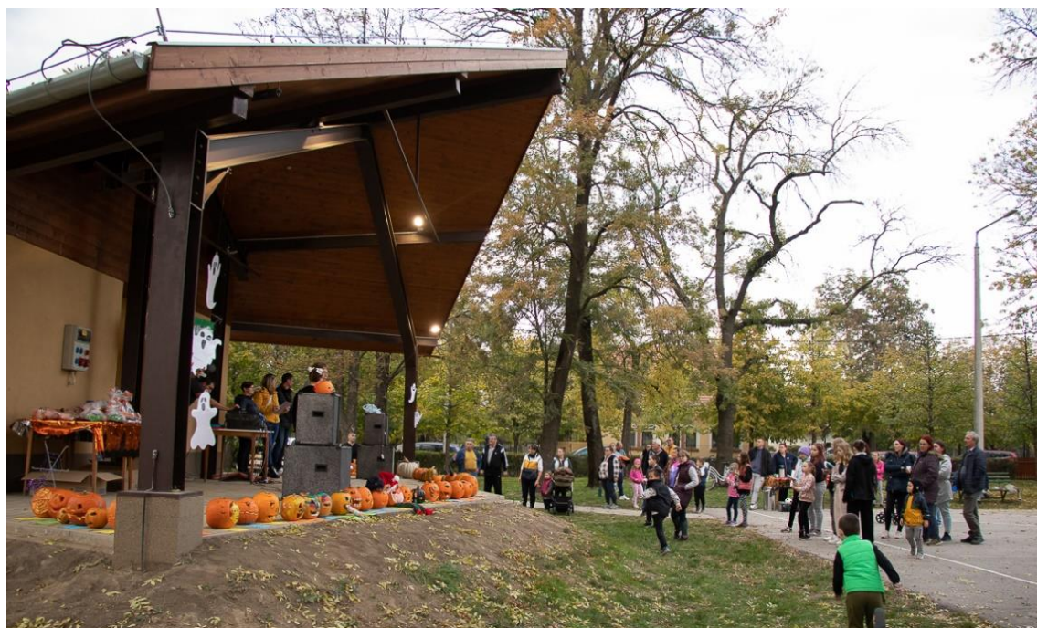
Negyedik tökfargó kiállítás és verseny a Petőfi utcai rendezvénytéren 2024. október 26-án

kialakítása, köztéri szobrok javítása és létrehozása, külterületi utak javítása, az Idősek Klubja udvarának parkosítása.