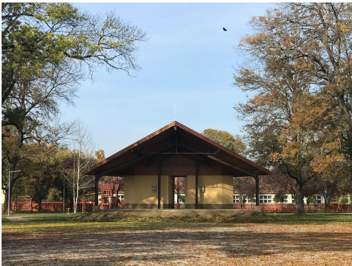
A rendezvénytér színpada