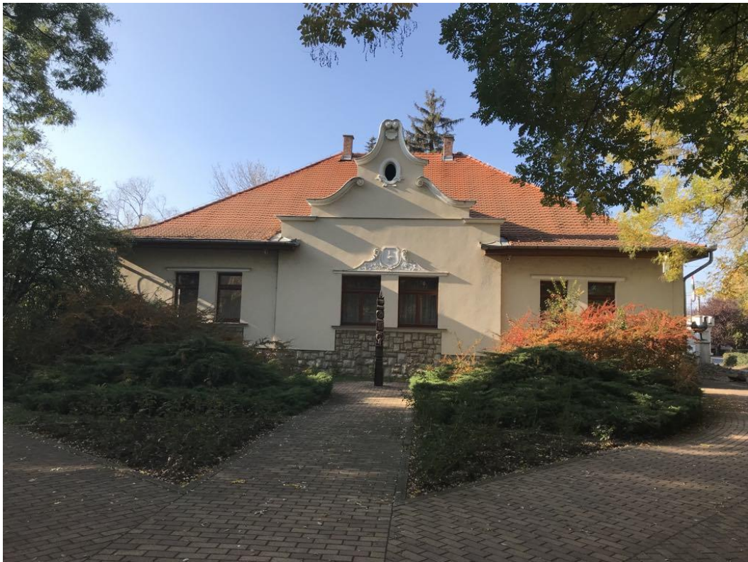
A Községháza épülete ősszel