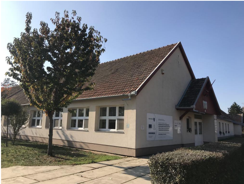
Trefort Ágoston Általános Iskola felső tagozata