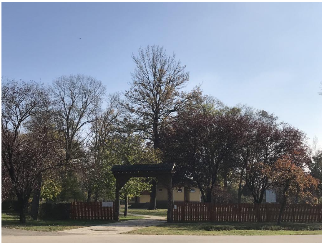
Székelykapu a Petőfi utcai rendezvénytéren