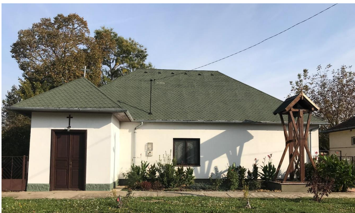
Magyarok Nagyasszonya-kápolna (Római katolikus)