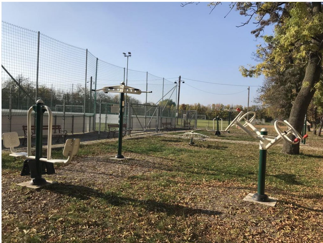
Edzőpark a sportpályánál